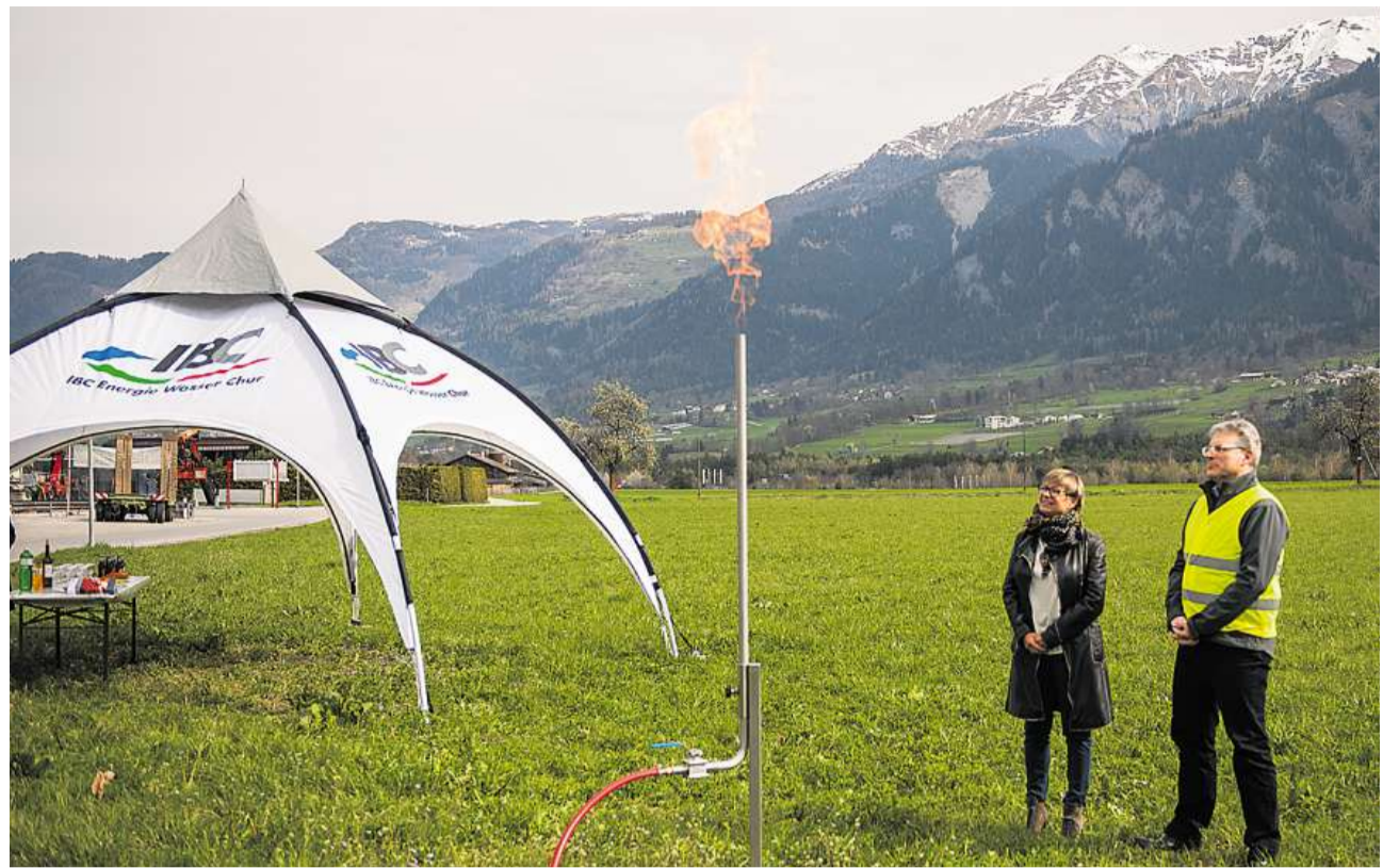
Es brennt: Die Bevölkerung von Thusis kann seit gestern mit Erdgas beliefert werden – demonstriert wurde das mit einem zündenden Feuer.

Inzwischen ist aber klar: Mehr Hotelgäste als in der letzten wird es in der Wintersaison 2013/2014 nicht geben. Zwar hat die Zahl der Logiernächte nach einer ersten Einschätzung im März tatsächlich um einige Prozentpunkte zugenommen. «Der Rückgang im Februar war aber deutlich höher, als wir ihn veranschlagt haben», räumte Wyrsh gestern ein. Das Minus sei so hoch ausgefallen, dass es im März nicht habe wettgemacht werden können. Tirol habe im Übrigen ganz ähnliche Zahlen registriert. Dies zeigt laut Wyrsh, dass dort wie hier die Wetterkapriolen der Hauptgrund für den Rückgang waren. (han)